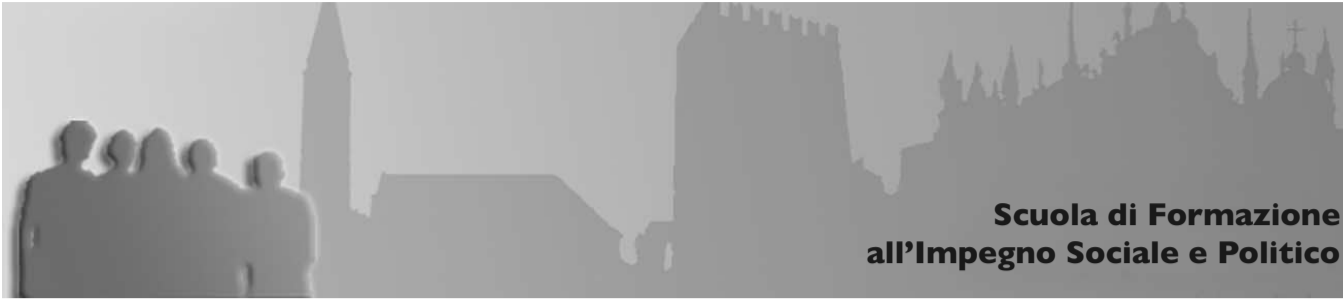
Scuola di Formazione all'Impegno Sociale e Politico