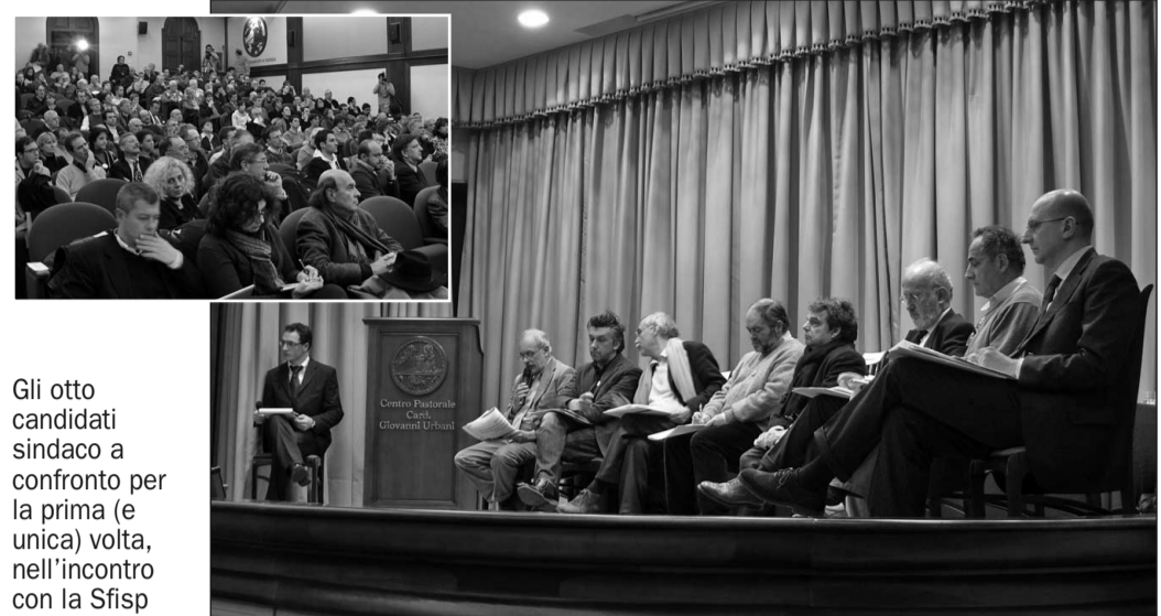
Gli otto candidati sindaco a confronto per la prima (e unica) volta, nell'incontro con la Sfisp

Secondo giro di interventi per dichiarare le proprie priorità in riferimento ai temi individuati dall'analisi dei programmi elettorali effettuata dai corsisti Sfisp: sanità, welfare; famiglia e giovani coppie; urbanistica ed infrastrutture; immigrazione; cultura, scuola, università, turismo e sport; lavoro e occupazione. «Sostegno alle persone in situazione di disagio; rivitalizzazione di Porto Marghera; no al Quadrante di